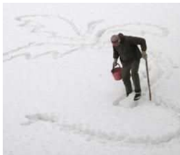
« Au loin, une île »