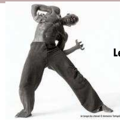
Le Tango du cheval