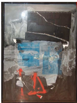
« Materia »